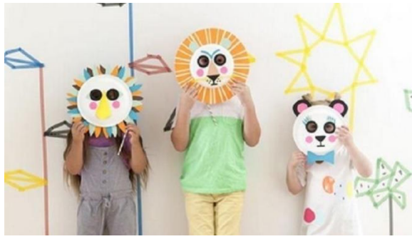
Figura 6 Ejemplo de máscaras.