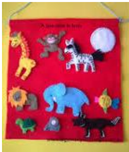
Figura 4 Franelógrafo.

Otra forma que se sugiere para representar el cuento es el franelógrafo, este también es de fácil confección ya que solo se necesita una base rectangular o cuadrada ya sea de cartón o cartulina, fieltro del color que se desee, goma o silicón, tijeras y su elaboración es muy simple ya que solo se debe cubrir el cartón con el fieltro y está listo para utilizarse, se puede usar cualquier cuento ya que las imágenes que se vayan a utilizar estarán emplastificadas y con un trozo de velcro el cual hace que se adhieran al franelógrafo, estas imágenes se van colocando conforme se narra el cuento para que los estudiantes tengan una visión de lo que la docente va contando, se pueden usar infinidad de cuentos, los mismos estudiantes lo pueden manipular y se puede utilizar para otras actividades que la docente considere oportunas.