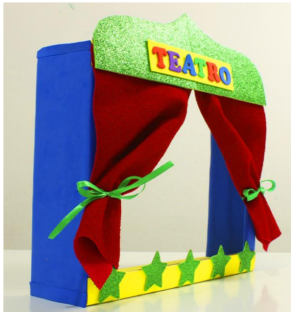
Figura 3 Teatrino.