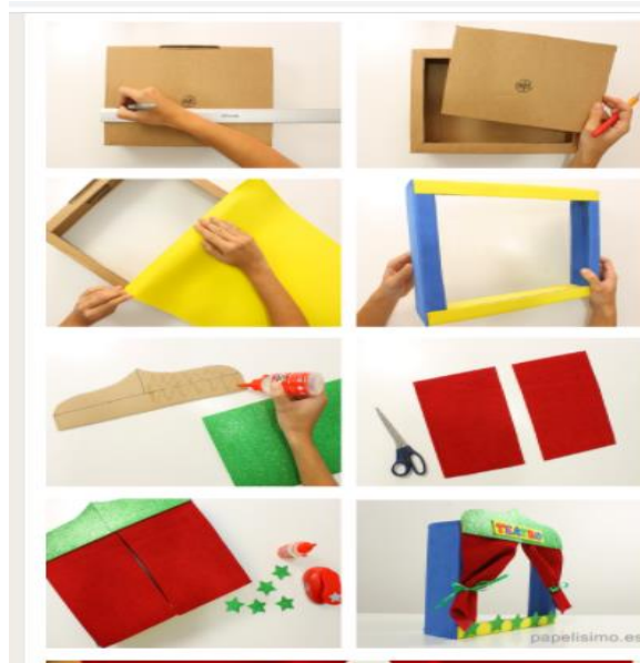
Figura 2 Pasos para elaborar teatrino.

más grande la docente puede manipular los personajes del cuento sin que se vea su mano o ella misma y los estudiantes prestaran más atención a la historia al ser narrada por los propios personajes.