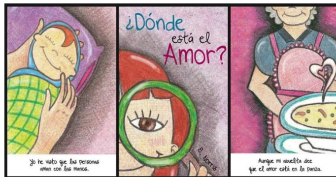
Figura 5 Ejemplo de álbum ilustrado.

Un álbum ilustrado solo requiere de la impresión de las ilustraciones ya sea que se impriman en hojas blancas y luego pegarlas en hojas de cartulina para que queden más firmes o bien imprimirlas en papel laminado para una mejor presentación. Esta estrategia puede que, si implique un gasto de tinta o de dinero, pero eso va a depender de la extensión del cuento además es muy llamativo para los estudiantes.